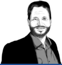
Reto Spiegel Mosaik Kommunikationsagentur

«Local Based Marketing» (LBM) oder standortbasiertes Marketing über mobile Endgeräte ermöglicht es, Kunden und solche, die es werden könnten, auf persönlicher Ebene und mithilfe von Standortdaten mit Online- oder Offline-Botschaften anzusprechen. Marketingteams sind so in der Lage, Interessierte noch gezielter zu erreichen, je nachdem, wie nahe diese sich gerade bei einem Geschäft befinden oder ob in einer bestimmten Region Veranstaltungen stattfinden. Welche Arten von standortbasiertem Marketing gibt es und worauf ist zu achten?